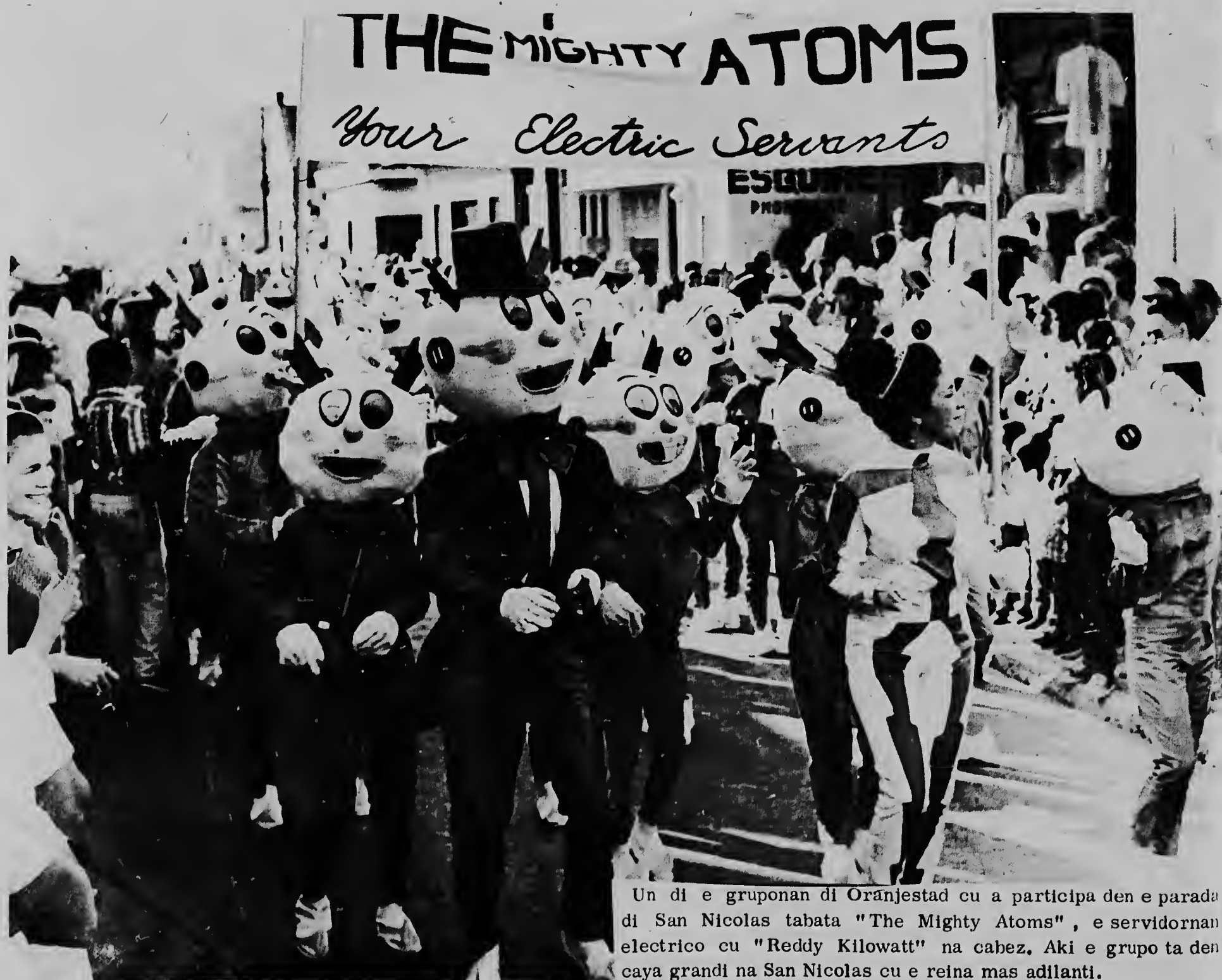
Un di e gruponan di Oranjestad cu a participa den e parada di San Nicolas tabata "The Mighty Atoms", e servidornan electrico cu "Reddy Kilowatt" na cabez. Aki e grupo ta den caya grandi na San Nicolas cu e reina mas adilanti.